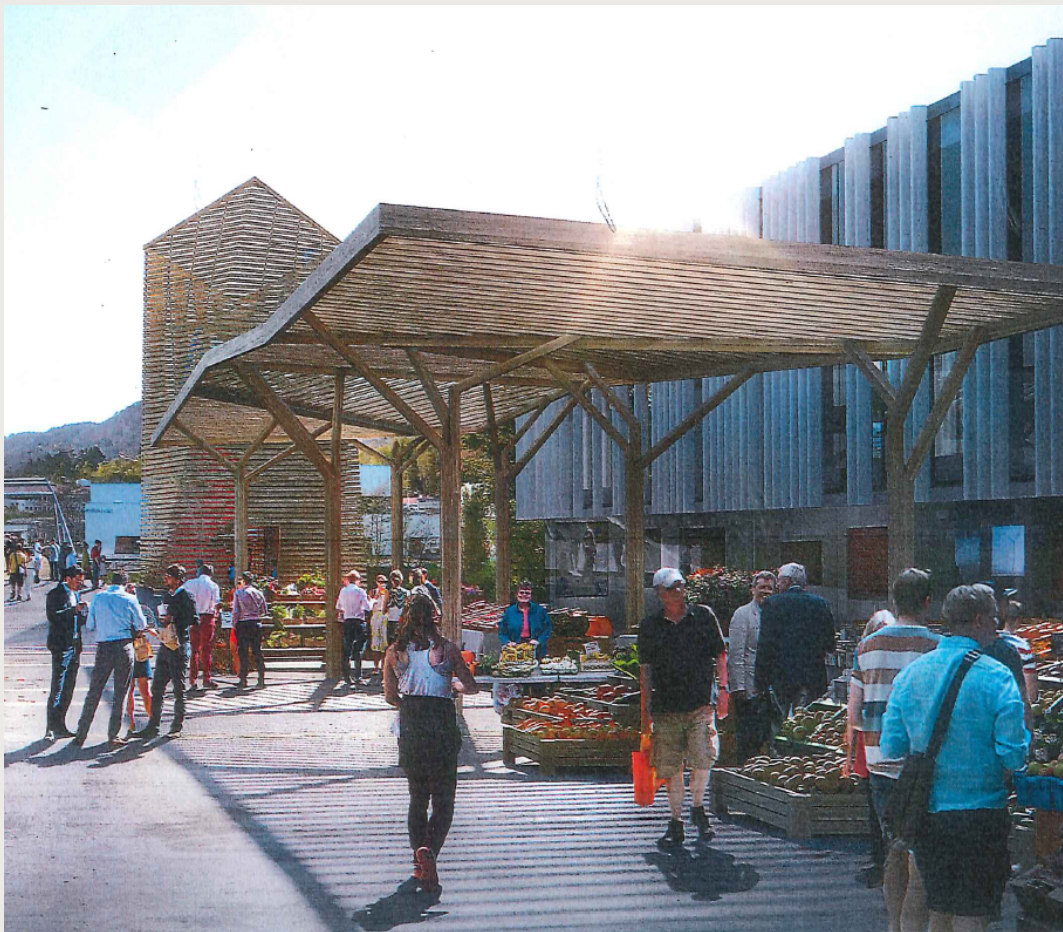
Mulighetsstudie Liknes: Snøhetta