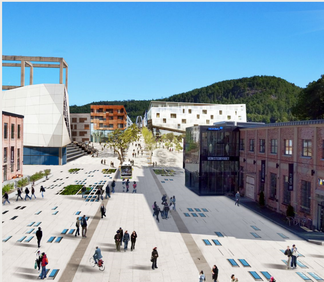
Illustrasjon: Trollvegg Arkitektstudio AS

Transformasjon (Mulighetsstudie Hunsøya i Vennesla – Trollvegg Arkitektstudio AS)