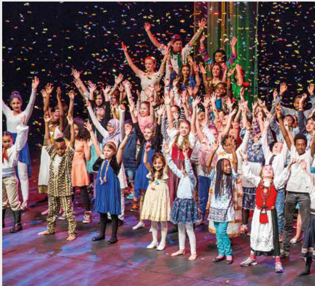
Kilden teater og Konserthus/Thomas Hegna, Fargespill 2015