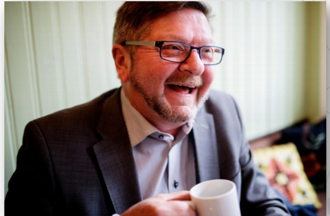
Fylkesmann for Agder - Stein Arve Ytterdahl