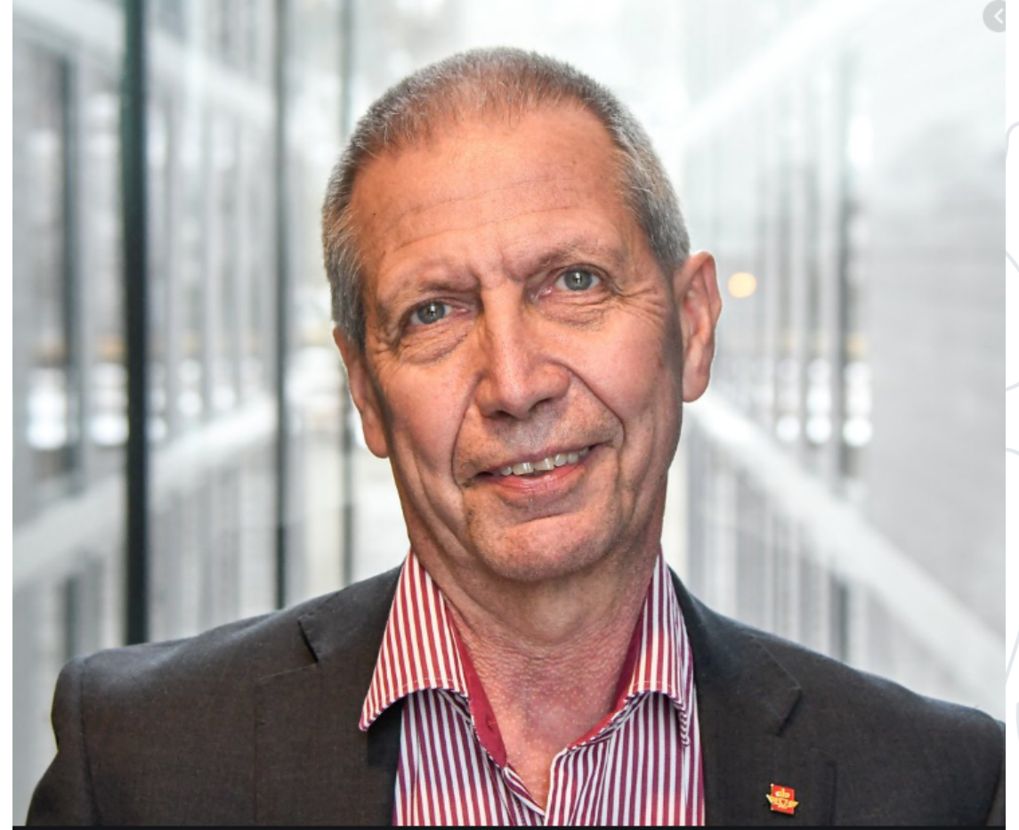
«Arealbruk er all transports mor» Tidl. Vegdirektør Terje Moe Gustavsen