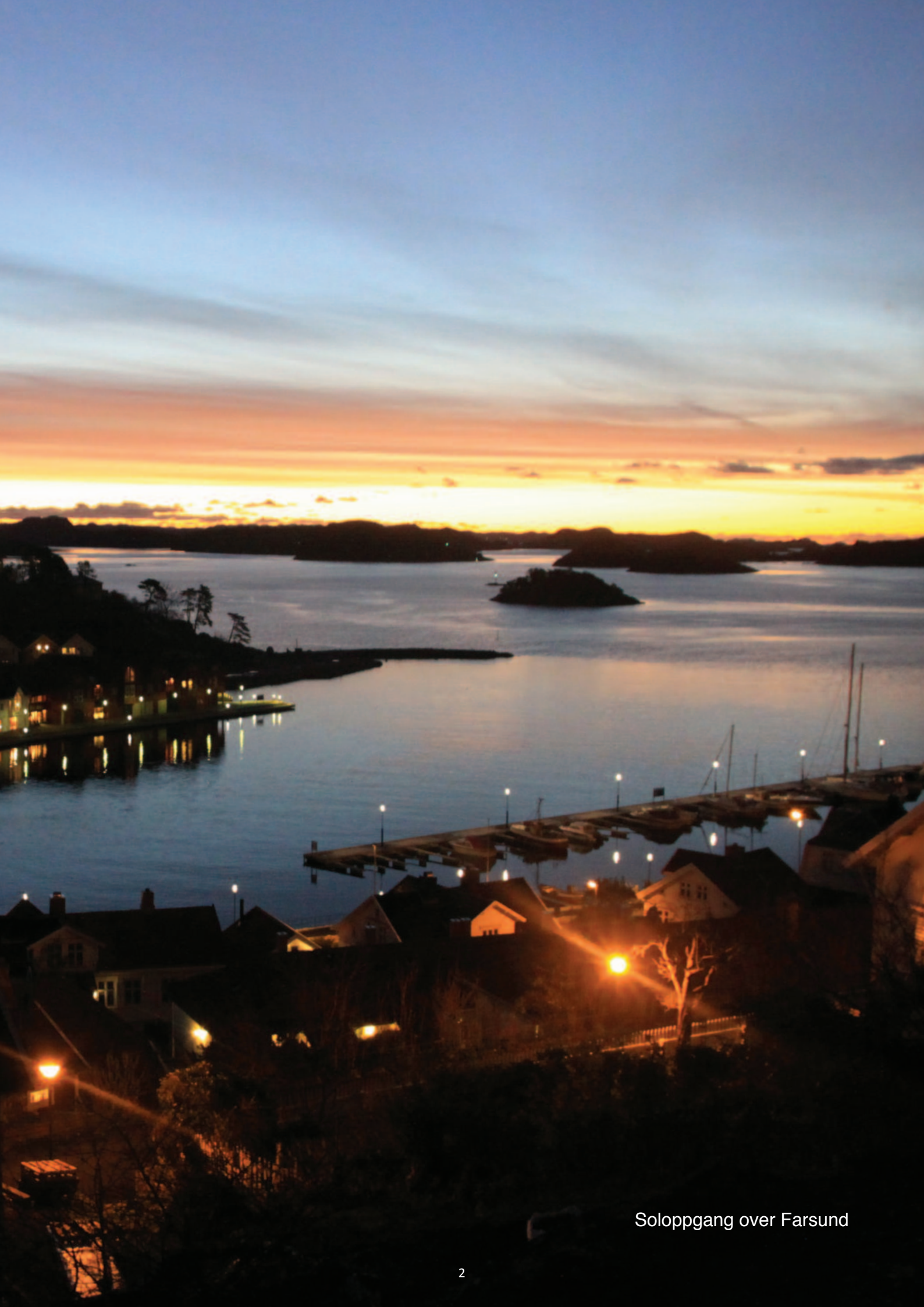
Soloppgang over Farsund