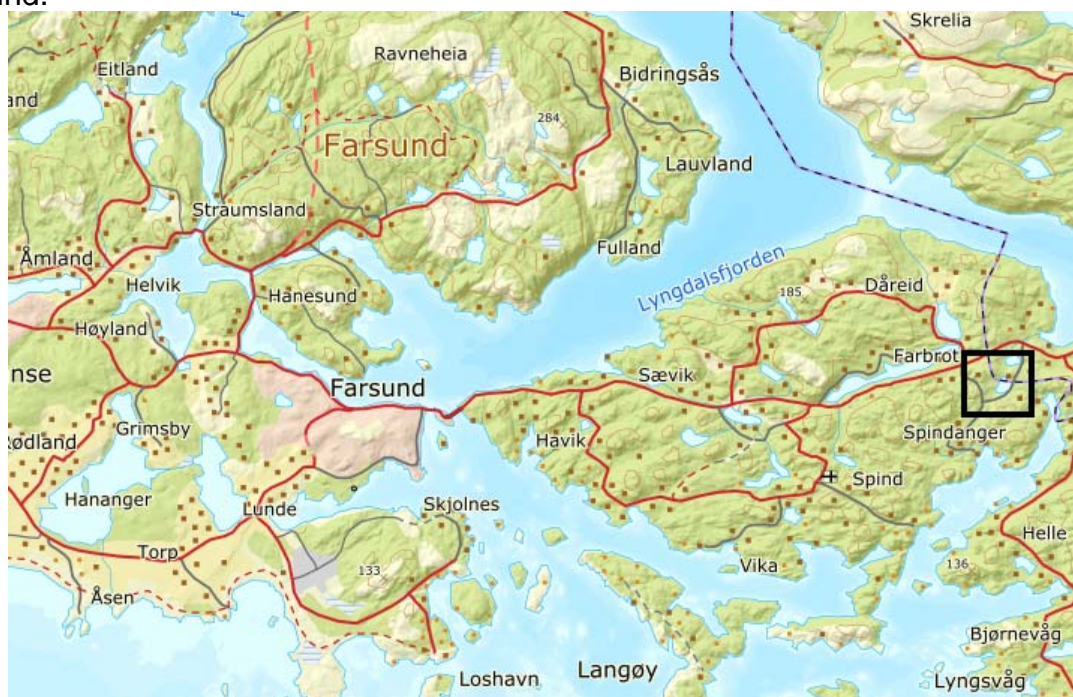
Figur 1 Oversiktskart. Planområdet er vist med rød firkant (ikke i målestokk).

Planområdet ligger på Spindanger, øst for Farsund sentrum. Gnr 236 bnr 1 og 4, Farsund.