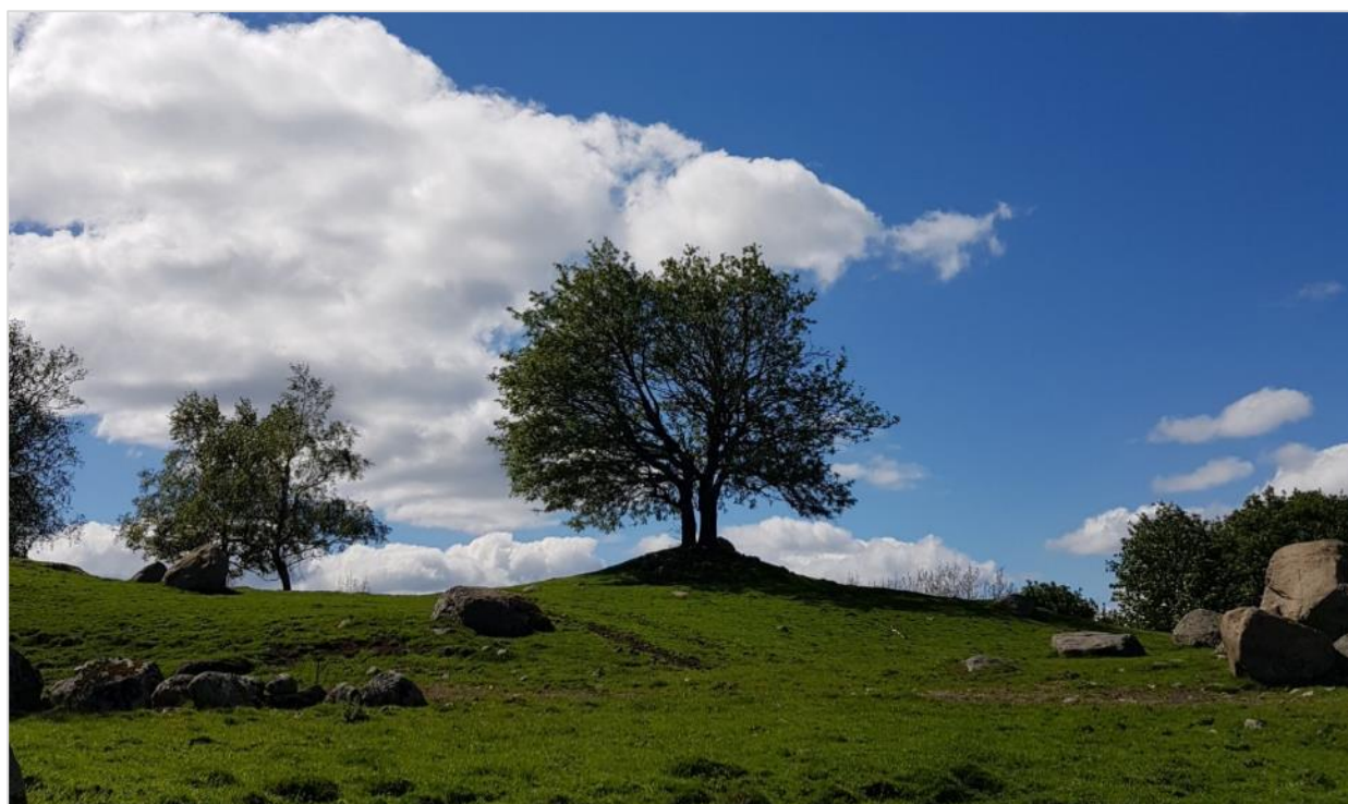
Gravhaug, Tjomsås i Vennesla.

På www.kulturminnesok.no kan man se hva som er registrert av kulturminner på ulike eiendommer.