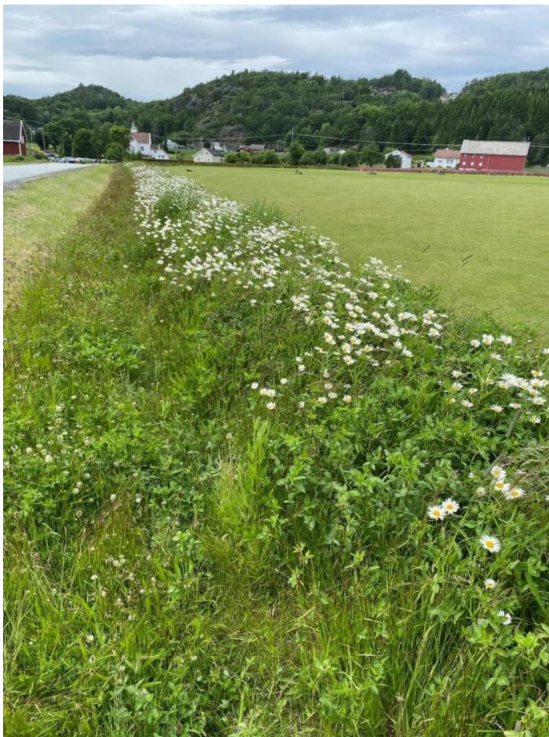
Blomsterstripe på jordbruksareal (Egen stripe, regional frøblanding), Landvik i Grimstad.