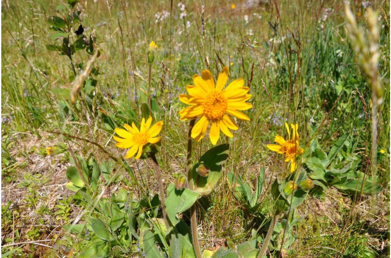
Solblom på slåttemark.

Skjøtselen skal i hovedsak utføres etter generelle skjøtselsråd.