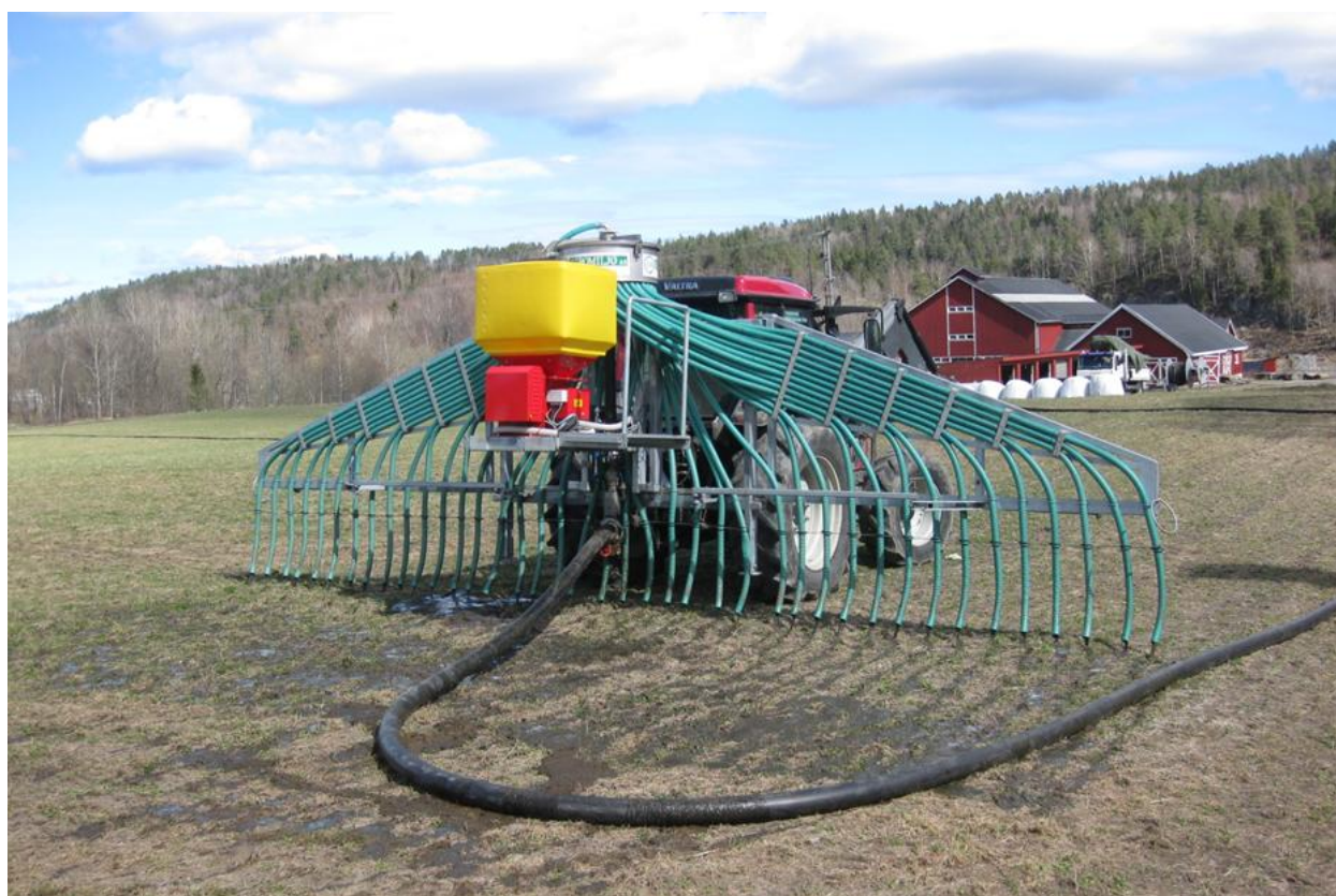
Bruk av tilførselsslange som tillegg til nedlegging av husdyrgjødsel med slangespreder, Mandal.