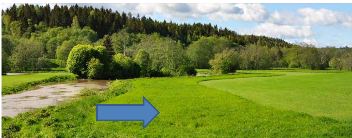
Kantsone i eng (markert med pil).