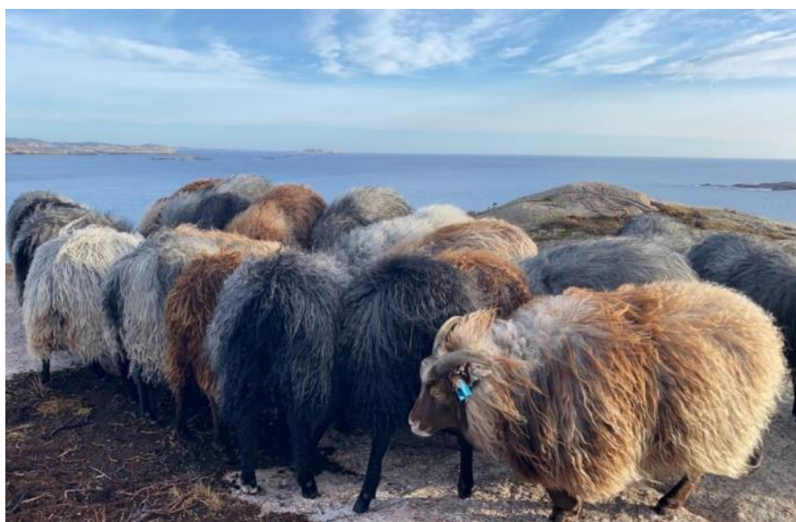
Gammel norsk spælsau på beite, Hilletunga i Lindesnes.

Det kan bare utbetales ett tilskudd til samme beitedyr for en beitesesong der samme område både er prioritert etter § 6 og § 7 for eksempel øya Hille utenfor Mandal. Søker må da velge å enten søke for jordbruksareal i § 6 eller søke for beitedyr på alt areal som beites i § 7.