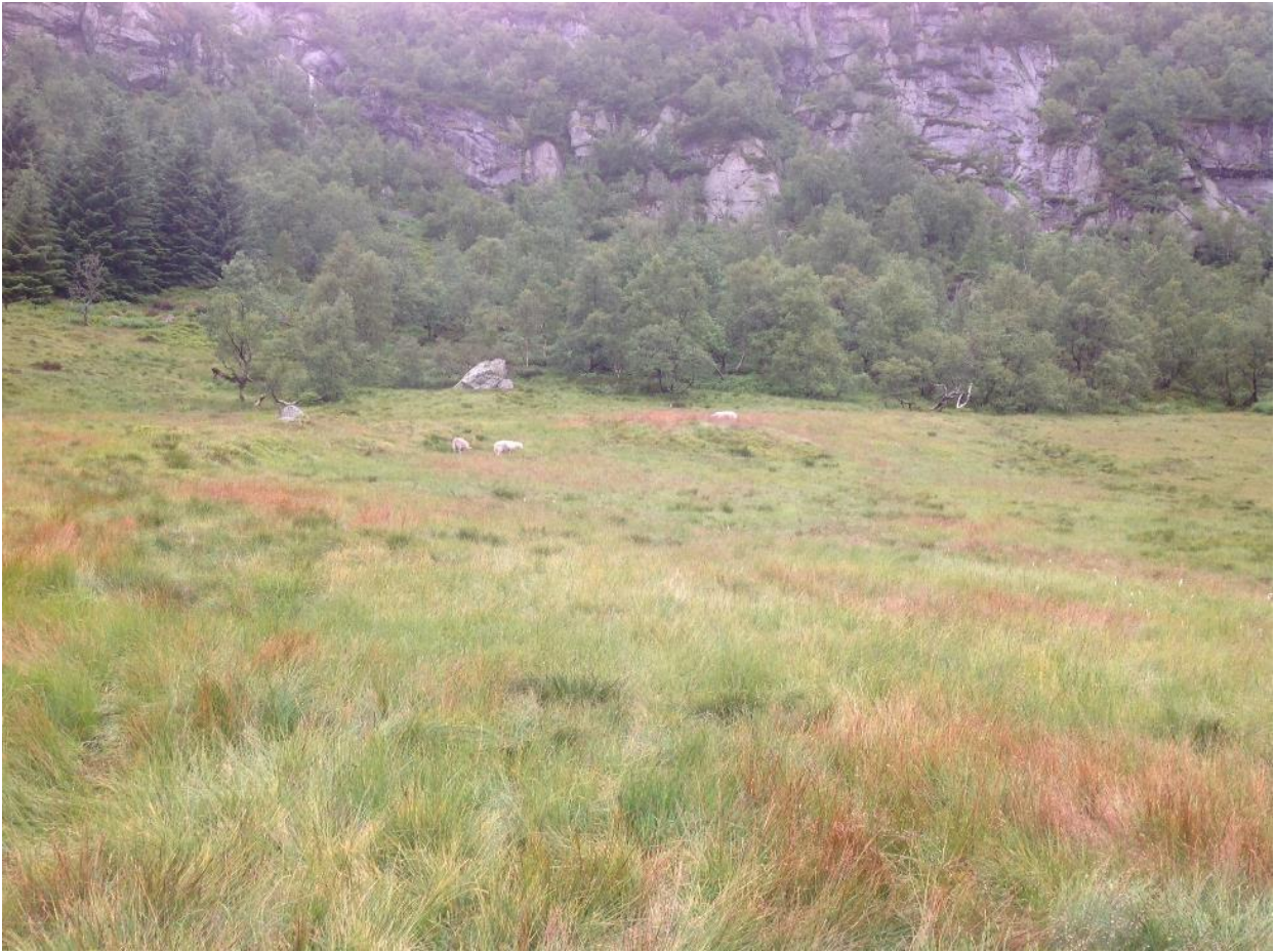
Slåttemark på Bryggesåhommen i Hægebostad.