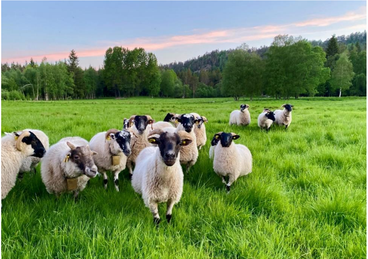
Svartfjes på beite, Birkedal i Grimstad.

Formålet med tiltakene under miljøtema Kulturlandskap er å ivareta jordbrukets kulturlandskap utover det en oppnår gjennom de nasjonale ordningene. Drift av bratt areal og Drift av beitelag skal bidra til å opprettholde tradisjonell drift, mens Beiting av verdifulle jordbrukslandskap skal bidra til å ivareta mer spesielle kulturlandskapsverdier i de prioriterte områdene.