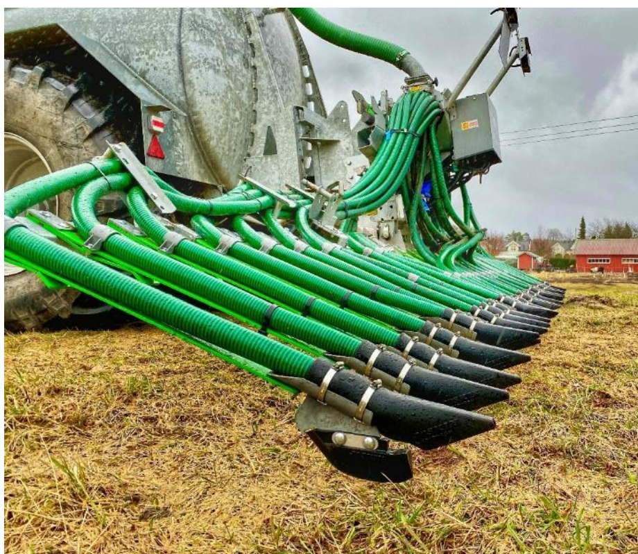
Gjødselvogn med spredebom for nedlegging av husdyrgjødsel, Arendal kommune.