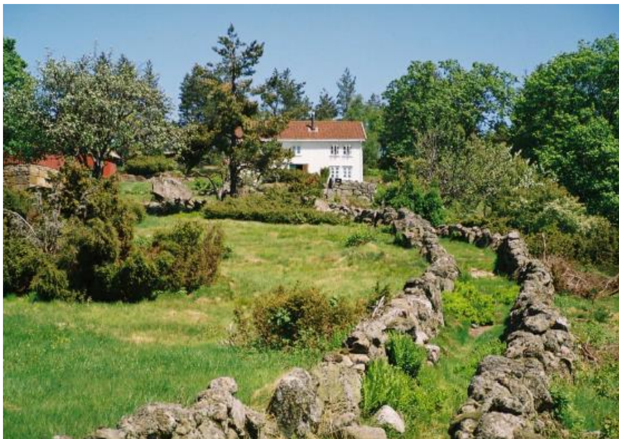
Buvei i Marnardal, Lindesnes.

Skjøtselen av kulturminnene skal i hovedsak utføres etter generelle skjøtselsråd.