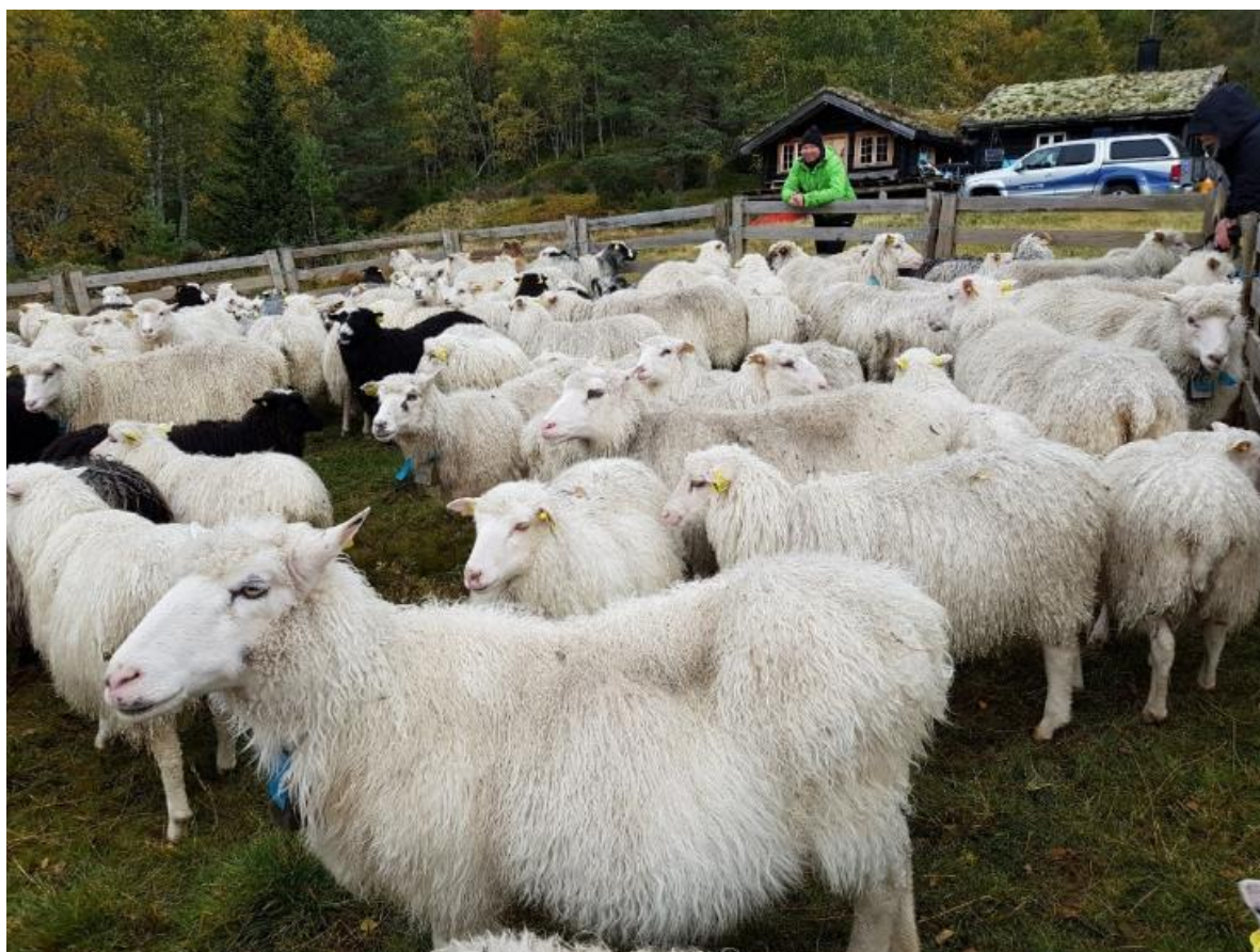
Samling av sauer på heia i Valle.

Tilskuddet utmåles per dyr som er sluppet på beite.