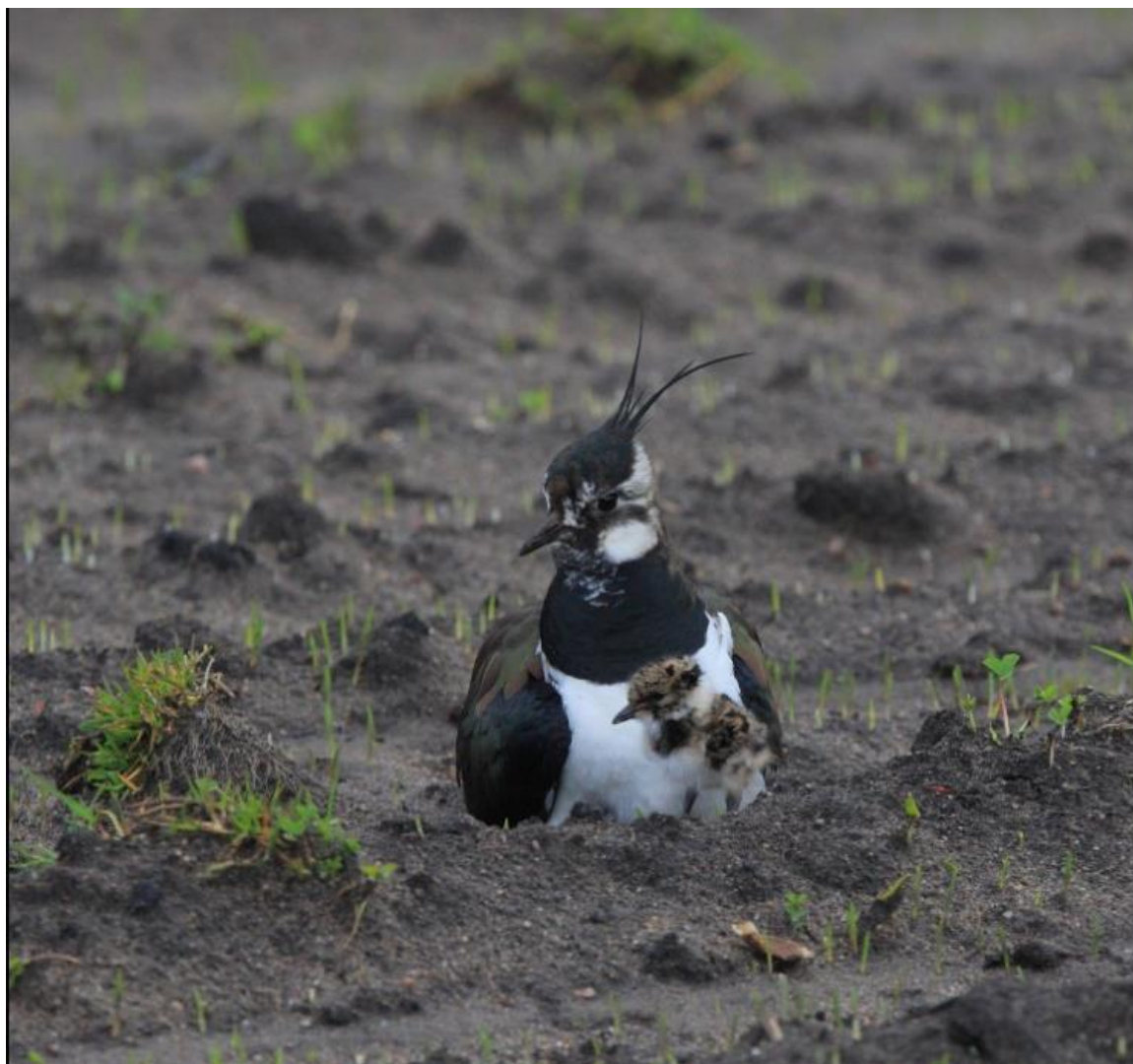
Vipe med nyklekket kylling på Årosjordet i Søgne, Kristiansand.