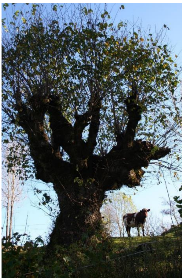
Hagemark med styvingstre.