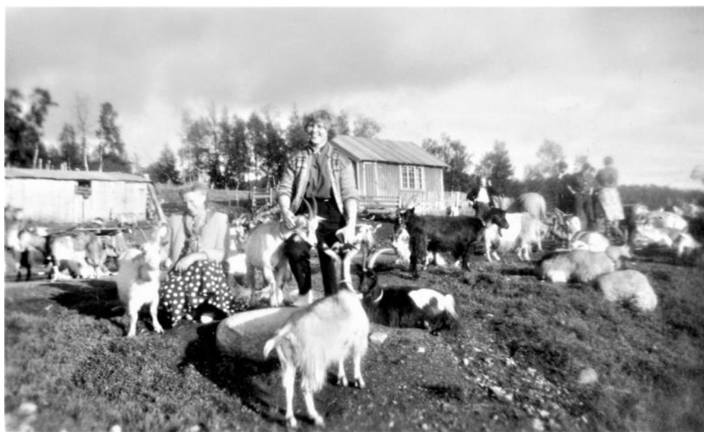
Seterdrift på Bjåen.

Det kan på samme seter ikke innvilges tilskudd til både § 15 Drift av seter og § 16 Besøksseter .