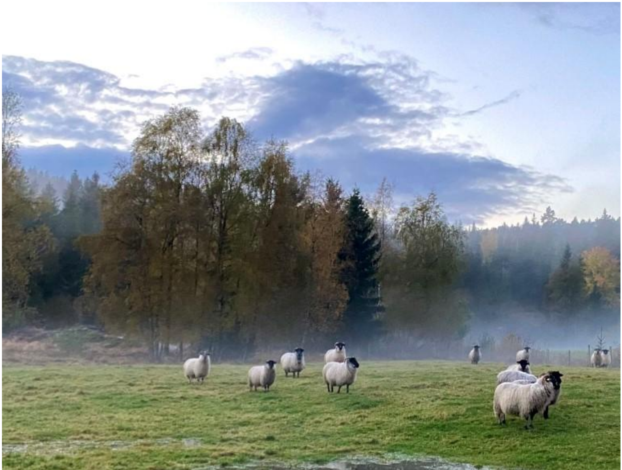
Sauer på beite, Grimstad.

Feil opplysninger i søknaden og brudd på vilkår kan føre til avkortning av tilskuddet.