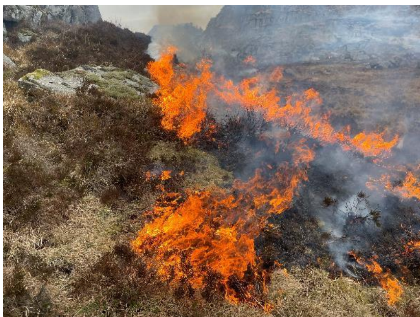
Brenning av kystlynghei, Jølleheia i Farsund.