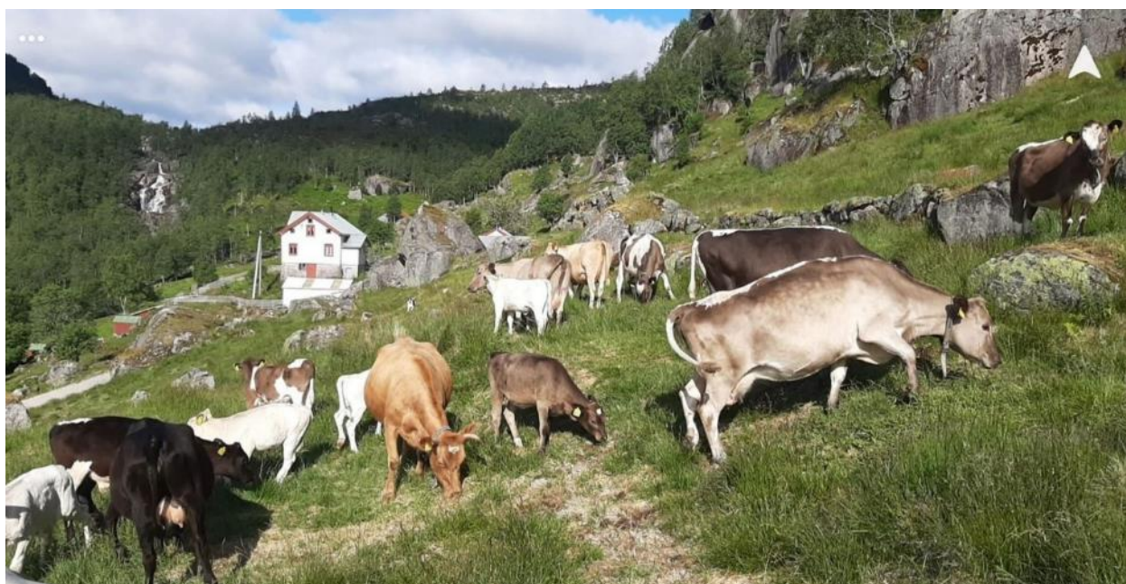
Vestnorsk fjordfe i bratt lende, Salmeli i Kvinesdal.