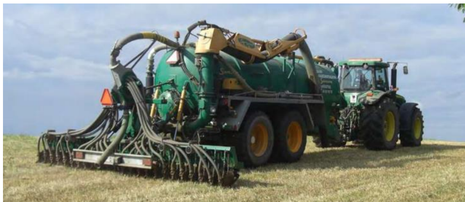
Nedfelling av husdyrgjødsel.

Tilskuddet kan kombineres med § 22 Spredning av all husdyrgjødsel om våren og eller i vekstsesongen på foretaksnivå, men arealet det søkes tilskudd for kan ikke overlape.