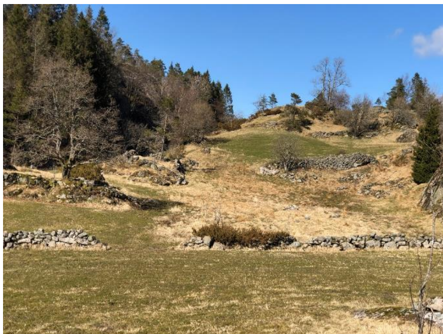
Bakkemurer på Håland, Lindesnes.