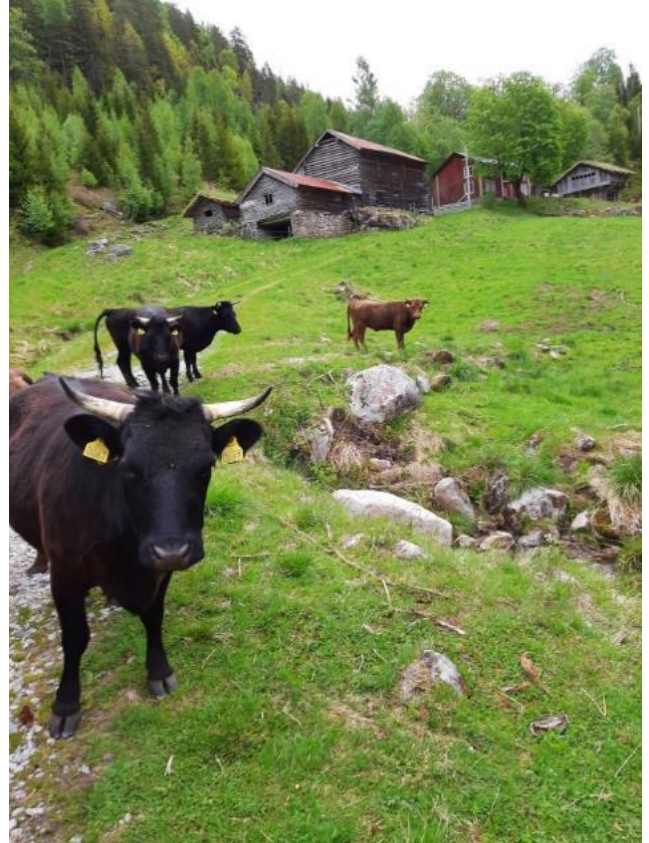
Dexterfe i bratt lende på Skåre i Bygland.